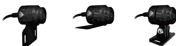
▶ 金屬支架 (平面型) ▶ 金屬支架 (L 型) ▶ 塑膠支架