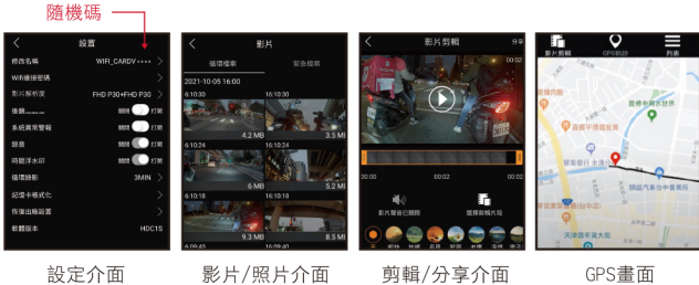
設定介面 影片 / 照片介面 剪輯 / 分享介面 GPS畫面