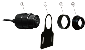
1. 鏡頭 2. 金屬支架 (平面型 / L 型) 3. 金屬套環 4. 鏡頭前蓋