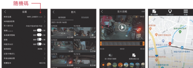
設定介面 影片 / 照片介面 剪輯 / 分享介面 GPS 畫面